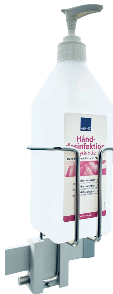
Botella cuadrada 67x67 mm