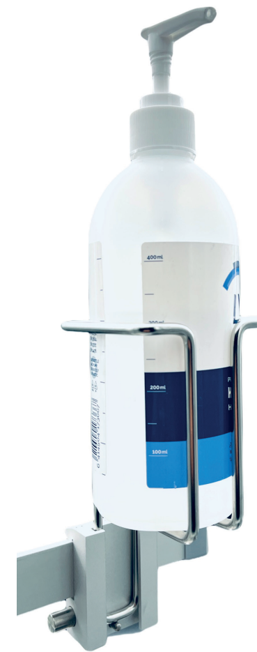
Botella redonda Ø70 mm